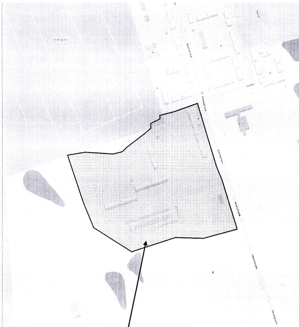
Схема границ территории, ограниченной ул. Мелиораторов, южной границей кадастрового квартала 64:32:051501 и юго-западной границей города Саратова в Ленинском районе города Саратова

Приложение № 1 к распоряжению министерства строительства и жилищно- коммунального хозяйства Саратовской области от 22.08.2023 № 7123-П